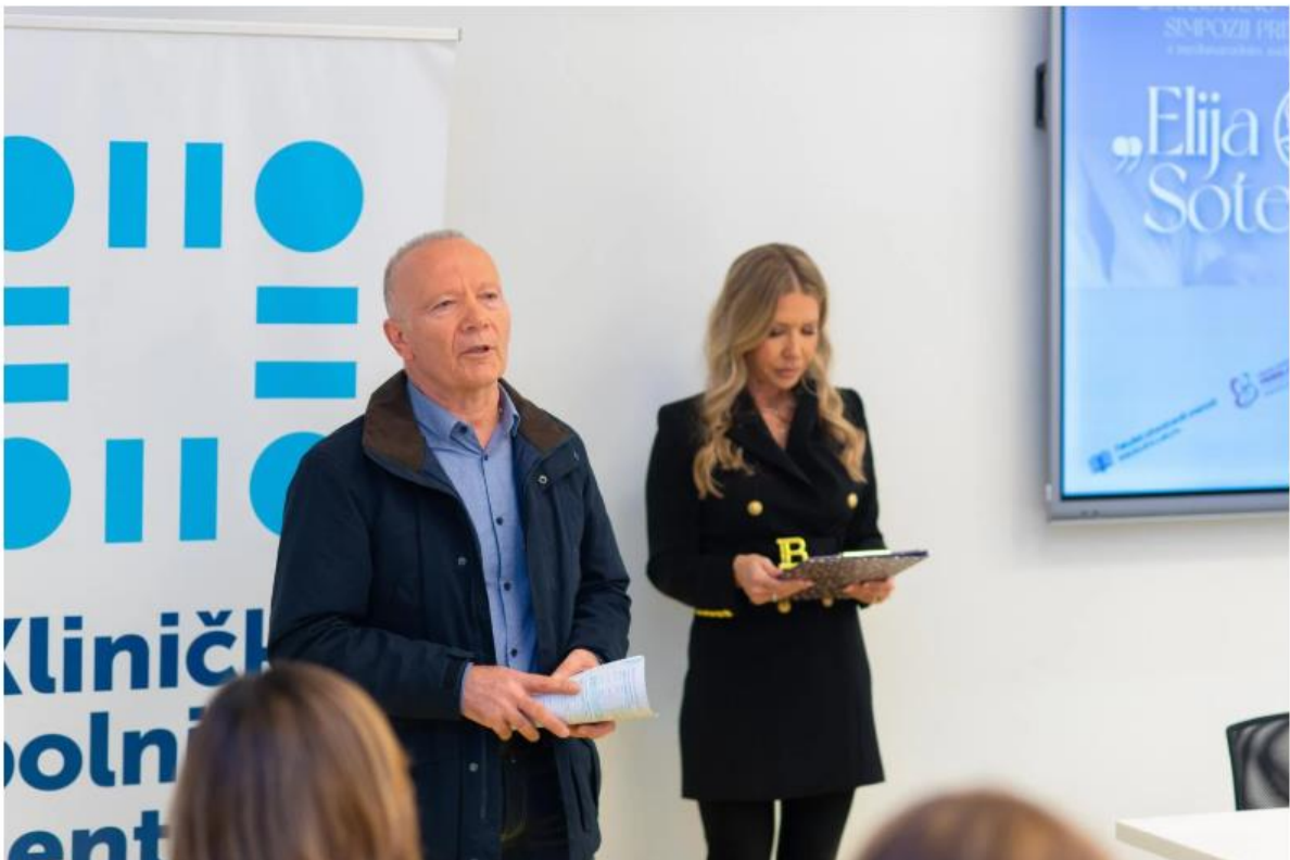
Simpozij Elija Sotera