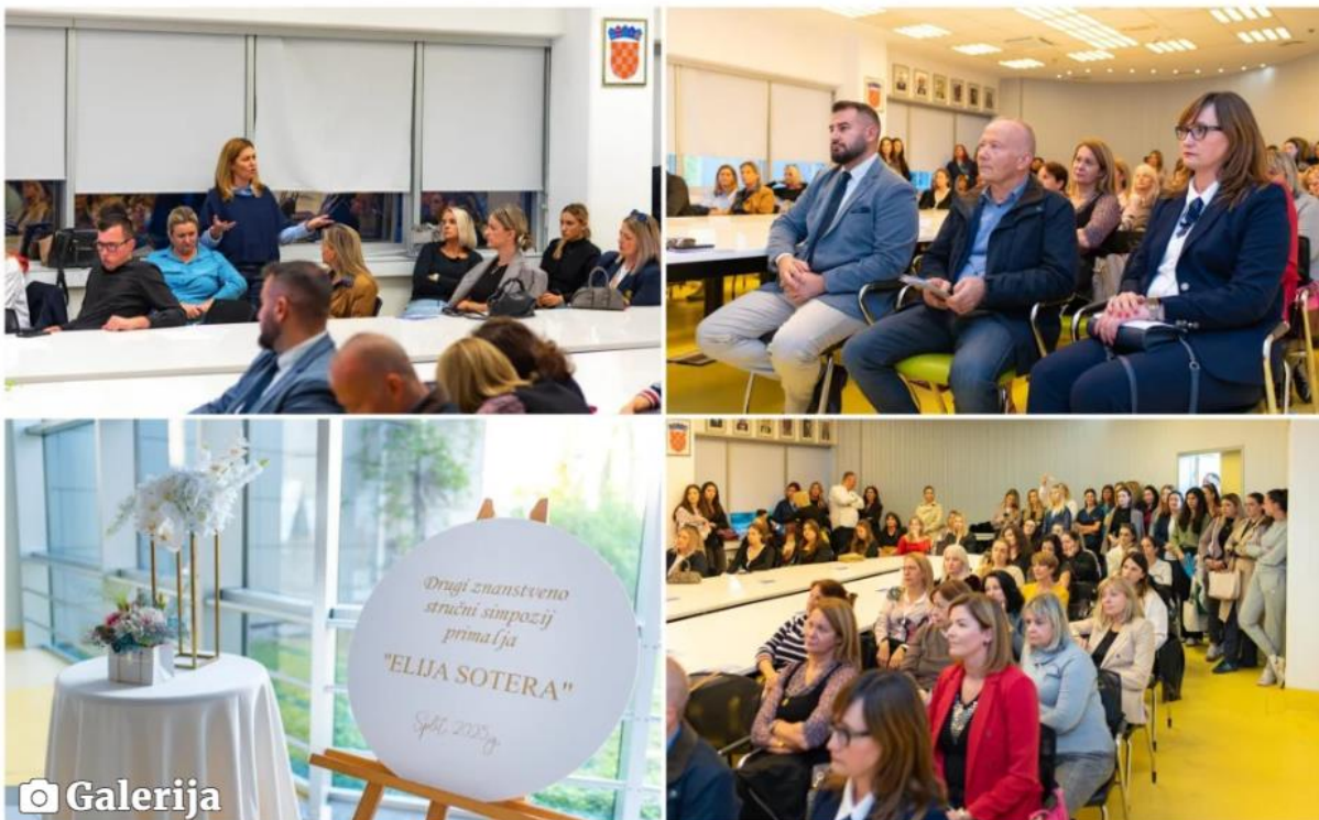
Simpozij Elija Sotera