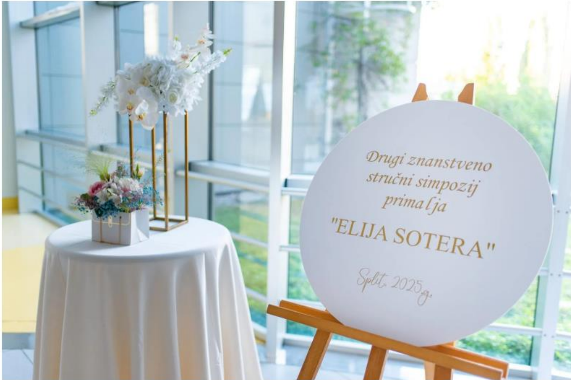
Simpozij Elija Sotera

Organizatori su bili Fakultet zdravstvenih znanosti Sveučilišta u Splitu, Hrvatska komora primalja - podružnica Splitsko-dalmatinske županije i Klinički bolnički centar Split, a simpozij nosi simbolični naslov „Elija Sotera“ po prvoj poznatoj primalji na našem području koja je živjela 2. stoljeću u Saloni.