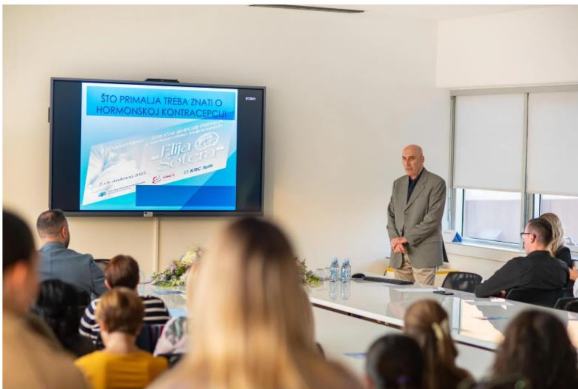
Simpozij Elija Sotera