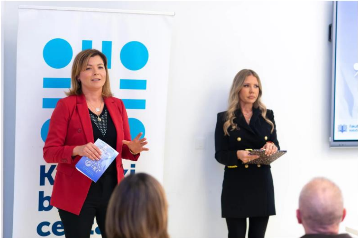
Simpozij Elija Sotera