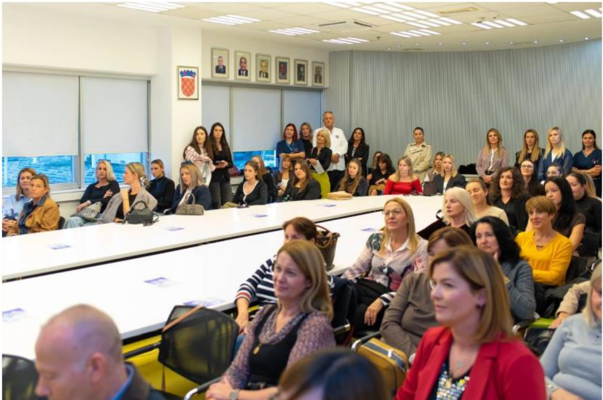
Simpozij Elija Sotera